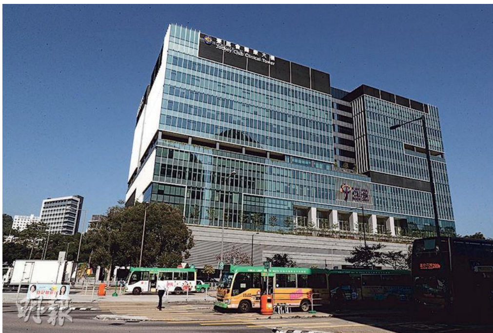
圖4之2-中大醫院（圖）預料，第三季開始協助處理公立醫院專科門診穩定新症病人及做日間手術。（資料圖片）